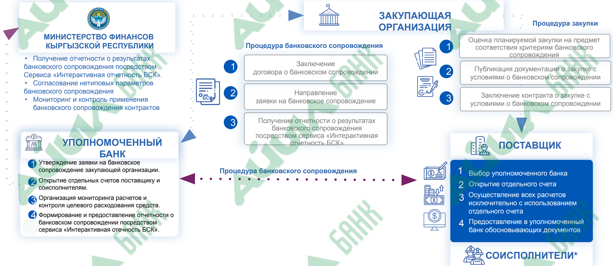
СХЕМА ВЗАИМОДЕЙСТВИЯ ПРИ ОСУЩЕСТВЛЕНИИ БАНКОВСКОГО СОПРОВОЖДЕНИЯ КОНТРАКТА В СФЕРЕ ГОСУДАРСТВЕННЫХ ЗАКУПОК