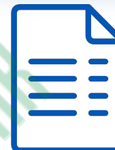
Схема направления заявок на перевод и обосновывающих документов в уполномоченный банк